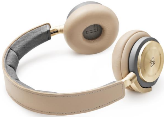
BeoPlay H8: Drahtloser High-end on-ear Kopfhörer mit Active Noise Cancellation UVP: € 499