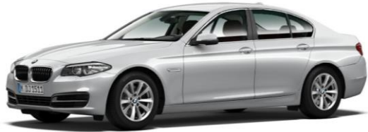
BMW 5er Serie