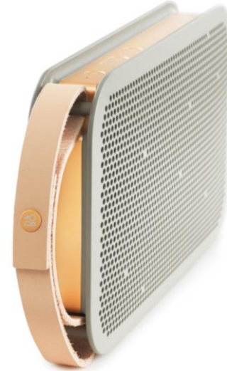
BeoPlay A2: Leistungsstarker, tragbarer Bluetooth Lautsprecher mit 360° Sound und bis zu 24 Stunden Akkulaufzeit. UVP: € 399