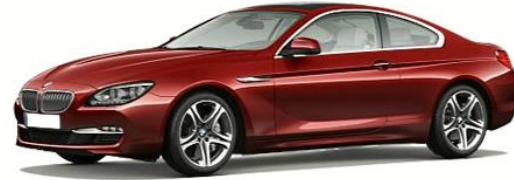
BMW 6er Serie